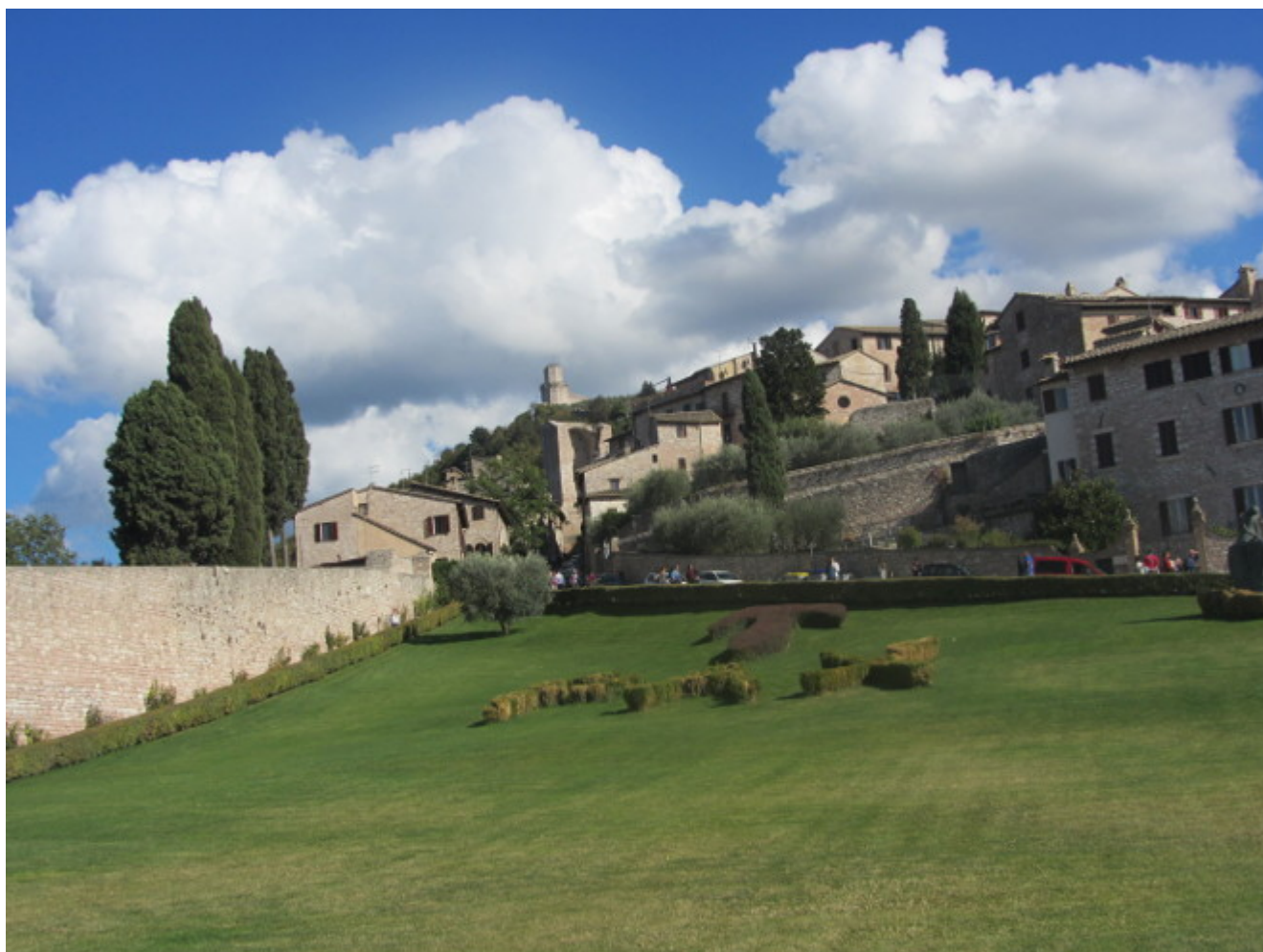
Auf den Spuren Franz von Assisi