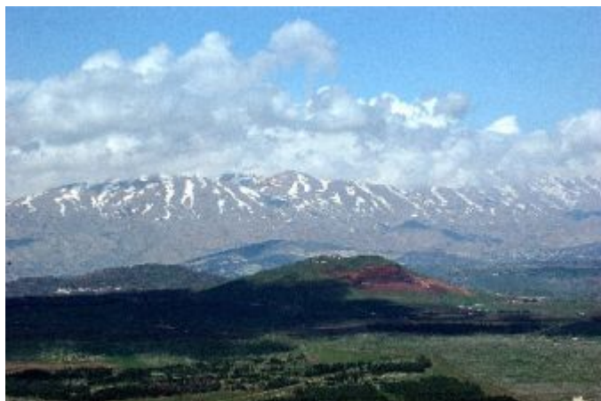
Reise durch das Heilige Land

Israel ist in jeder Hinsicht ein Land der Gegensätze. Geschichte, Tradition und gleichzeitig ein modernes Leben, Träume, Erinnerungen aber auch Zukunftshoffnungen - all dies liegt hier dicht beieinander. Das Land, das unwillkürlich alle Menschen in seinen Bann zieht, übt auf den Besucher eine schon fast magische Anziehungskraft aus.