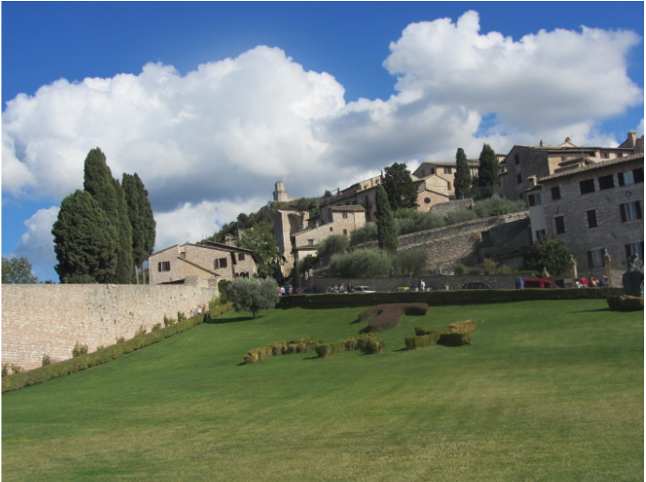
Auf den Spuren Franz von Assisi