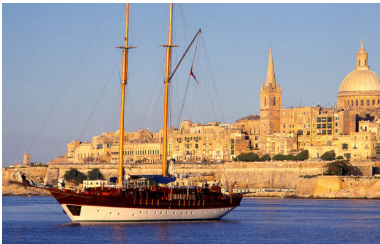
Auf den Spuren des Apostel Paulus