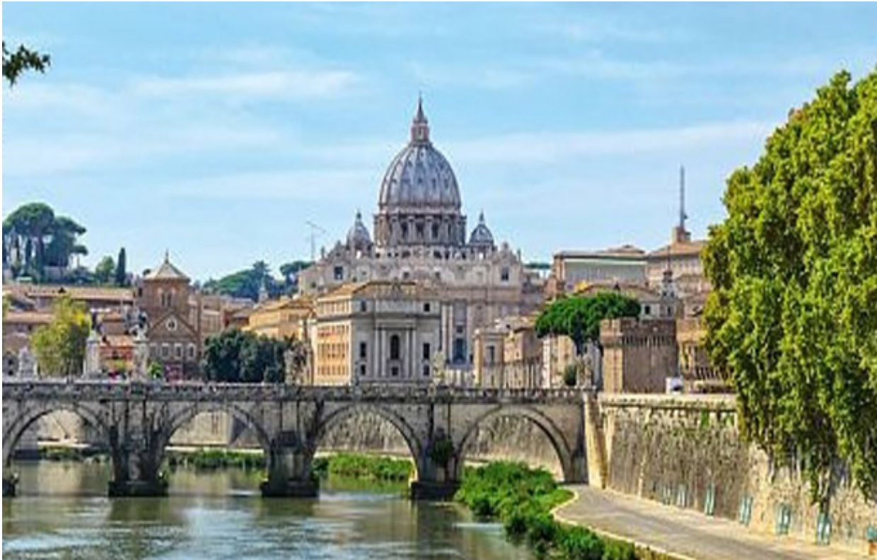
Reise in die heilige Stadt