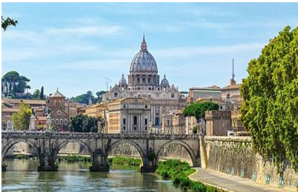
Reise in die heilige Stadt