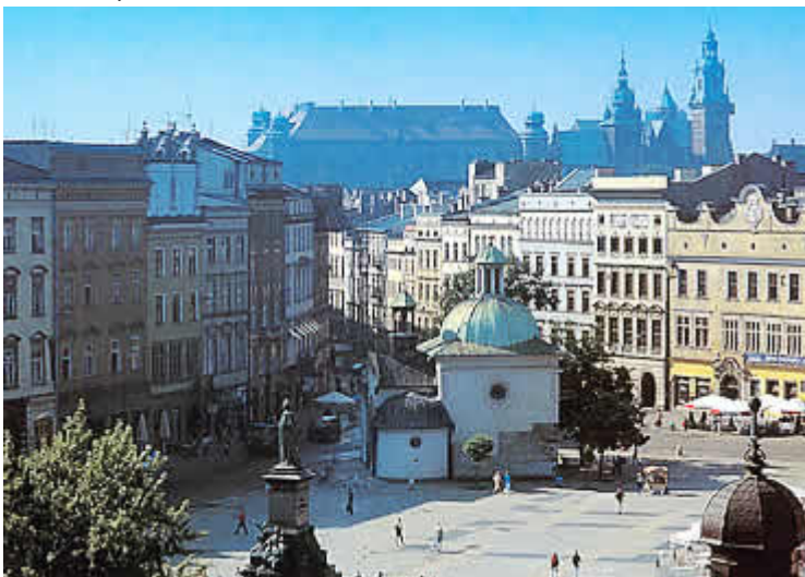
Polen - Krakau und Auschwitz