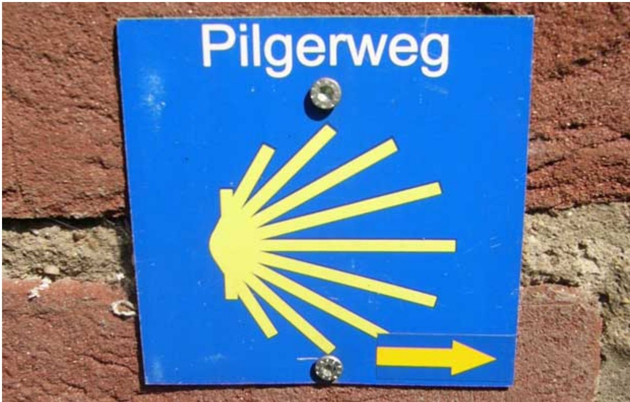
Pilgern quer durch Europa

Seit über 1000 Jahren folgen Menschen aus den verschiedensten Gründen dem Zeichen der Muschel nach Südwesten. Für die einen ist der Camino de Santiago eine spirituelle Erfahrung, für die anderen eine sportliche Herausforderung und für Dritte eine ur-europäische Verbindung. Sie alle eint die Faszination eines uralten Weges quer durch Europa... ..